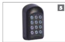
5 Teclados SMARTGUARD o SMARTGUARDair Teclados inalámbricos, rentables y versátiles para permitir el acceso de los peatones.