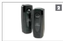
2 Rayos Infrarrojos CENTURION Siempre recomendado en cualquier instalación de motores para accesos.