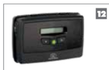
12 Dispositivo GSM G-ULTRA La nueva solución GSM para monitorear y activar el operador a través de su teléfono móvil.