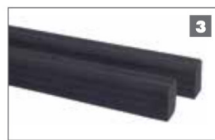
3 P36 El borde proporciona protección adicional contra aplastamiento.