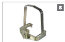
8 Jaula antirrobo y candado Jaula de acero diseño retro, que aumenta la resistencia del operador contra robo.