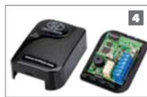
4 WiZo-Link Módulo Módulo inalámbrico de entrada-salida que utiliza tecnología de red de malla, creando conexión entre dispositivos en un sistema completamente inalámbrico.