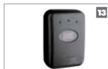
13 SOLO/Lattice control de acceso por proximidad Lector de proximidad para permitir acceso a peatones y vehículos.