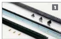
1 Rack angular de acero, nylon RAZ o nylon Una variedad de repisas disponibles en diferentes longitudes, para diferentes fuerzas.