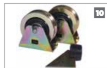
10 Kits de ruedas Una variedad de kits de ruedas disponible con su distribuidor de CENTURION.