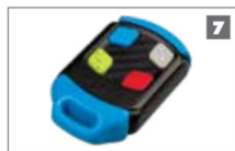
7 Controles Remotos CENTURION Disponible en uno, dos, tres y de cuatro botones. Incorporado salto de código encriptado.