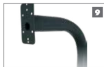
9 Cuello de cisne Poste de acero para montar la estación de intercomunicación o el lector de control de acceso.