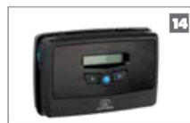
14 G-SPEAK ULTRA Comunicación inalámbrica entre el usuario y la estación de intercomunicación, convirtiendo el teléfono del usuario en el auricular de intercomunicación.