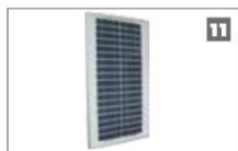
11 Suministro solar Generación alternativa de energía en el sistema. Consulte a su distribuidor CENTURION