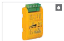
6 Detector de bucle FLUX SA Permite la salida libre de vehículos de la propiedad: requiere de la instalación de un bucle..